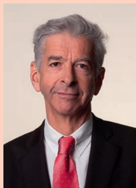
Ronald Plasterk Minister van Binnenlandse Zaken en Koninkrijksrelaties

Ik wens u veel plezier bij het bekijken van de tentoongestelde kunstwerken. En ik hoop dat het u nieuwe inspiratie geeft!